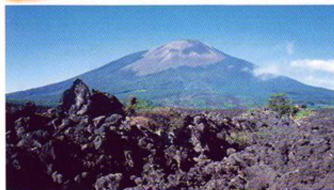
初夏の焼走り熔岩流と岩手山