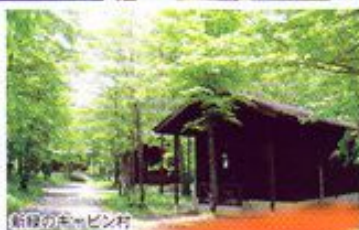
新緑のキャビン村